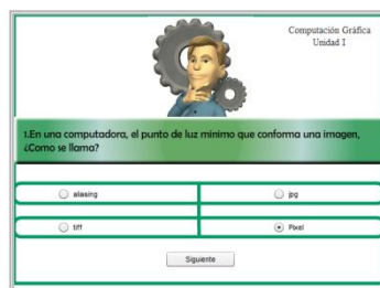
Figura 2. Objeto de Aprendizaje: Test de Autoevaluación. Cátedra Virtual de Computación Gráfica

Otro de los objetos de aprendizaje diseñados ha sido el test con preguntas para que los estudiantes realicen una autoevaluación y puedan medir el aprendizaje obtenido luego de revisar cada una de las unidades.